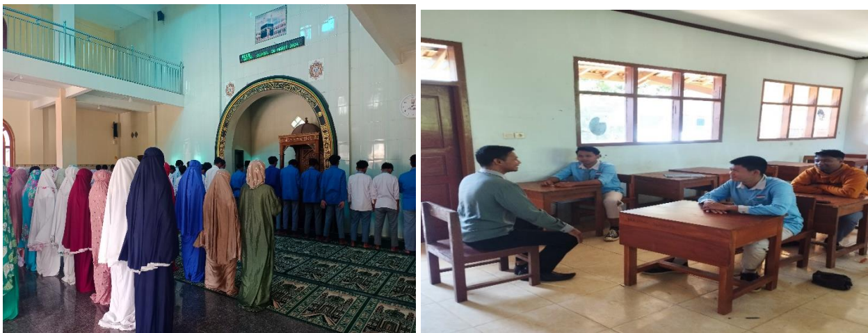
Gambar 4. Kegiatan shalat Duha dan Tadarus

Disampaikan dalam sesi wawancara dengan kepala sekolah bahwa;