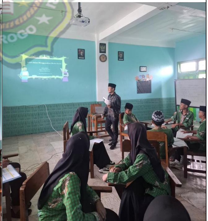
Observasi Kegiatan Pembelajaran