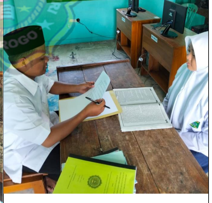
Wawancara Siswa MTs Pertanian Kota Madiun