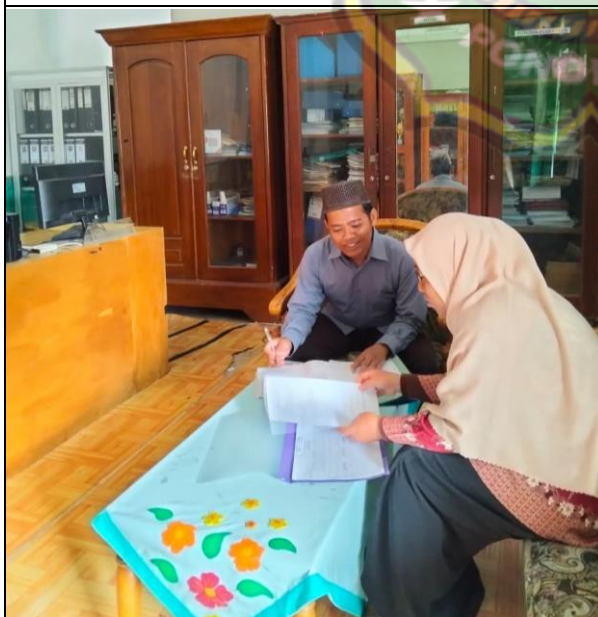
Wawancara Waka Kurikulum MTs Pertanian Kota Madiun