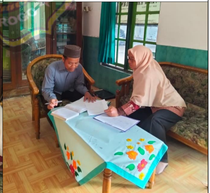
Wawancara Waka Kurikulum MTs Pertanian Kota Madiun