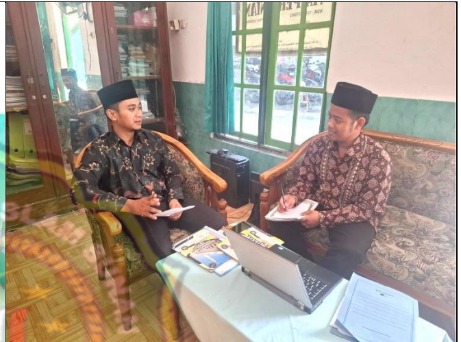
Wawancara Guru Aqidah Akhlak MTs Pertanian Kota Madiun