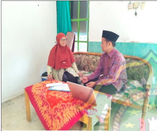
Wawancara kepala sekolah MTs Pertanian Kota Madiun