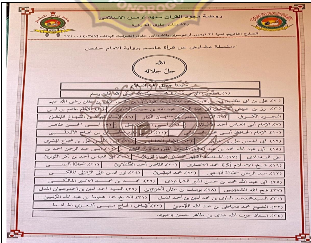
Sanad Al – Qur'an Pondok Tremas bersambung sampai kepada Nabi Muhammad SAW.