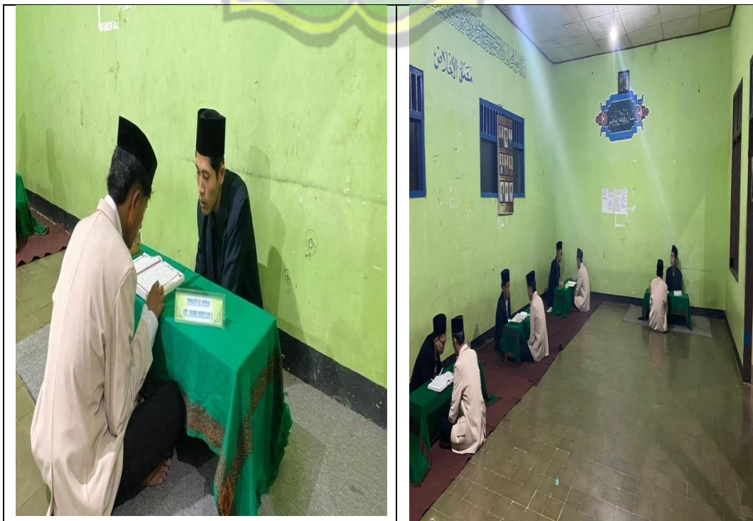
Pelaksanaan ujian Al – Qur'an santri El - Yamin kepada Dewan Penguji Al – Qur'an lembaga Ma'hadiyah PIP Tremas