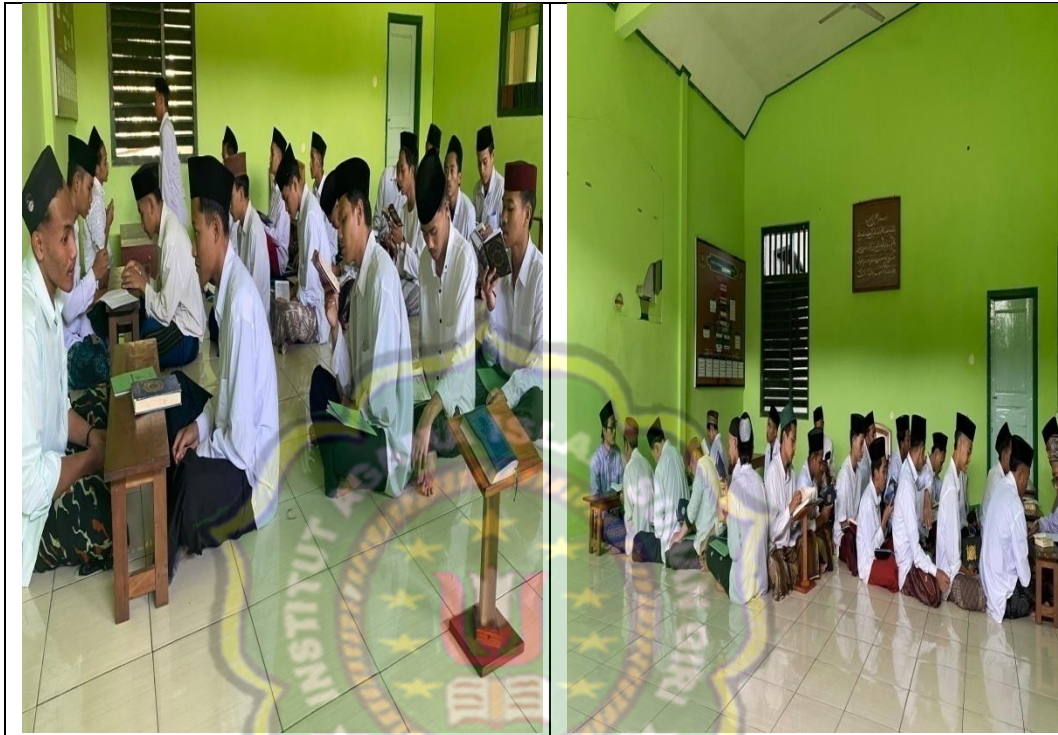
Kegiatan sorogan santri El - Yamin dilaksanakan setiap hari : Selasa, Rabu, Kamis.