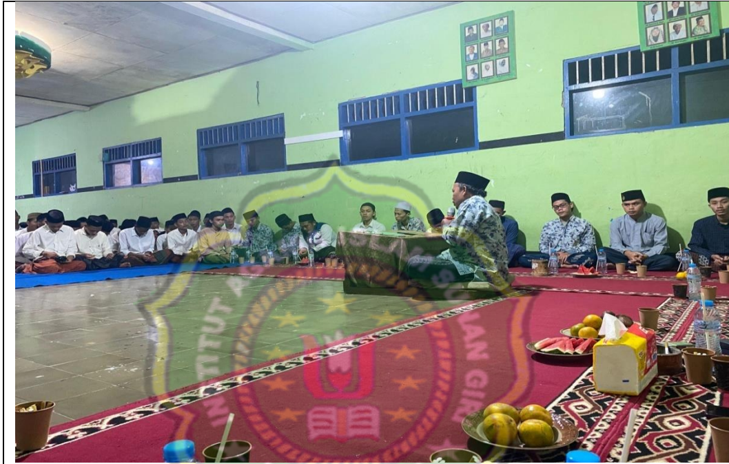
Pembukaan Kegiatan Pembelajaran Sorogan Al - Qur'an Santri El - Yamin di Asrama El - Yamin, Sabtu 18 Mei 2024 M.