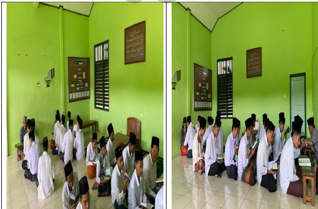
Kegiatan Sorogan Al – Quran santri El - Yamin kepada Muallim RMQ