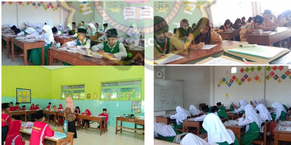
Gambar 2. Suasana Pembelajaran di Ruang Kelas di MI Ma'arif Panjeng Jenangan Ponorogo