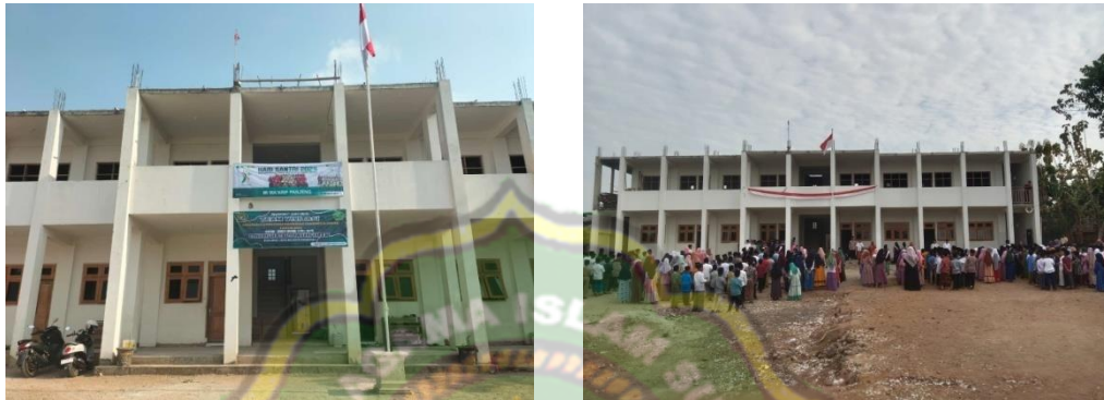
Gambar 1. Bangunan Gedung MI Ma'arif Panjeng Jenangan Ponorogo