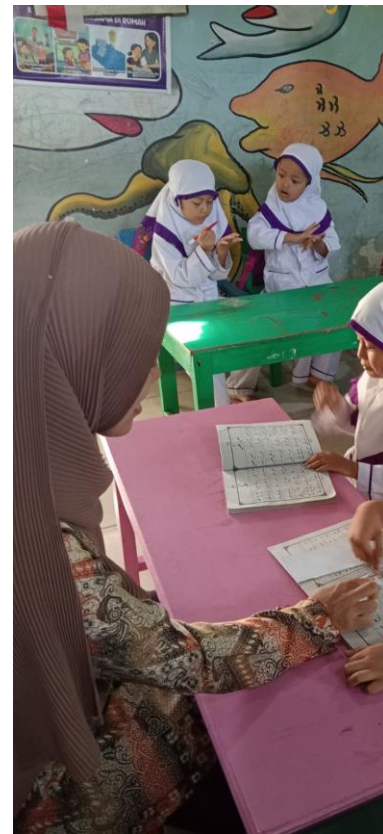
Kegiatan Peserta didik setoran membaca huruf