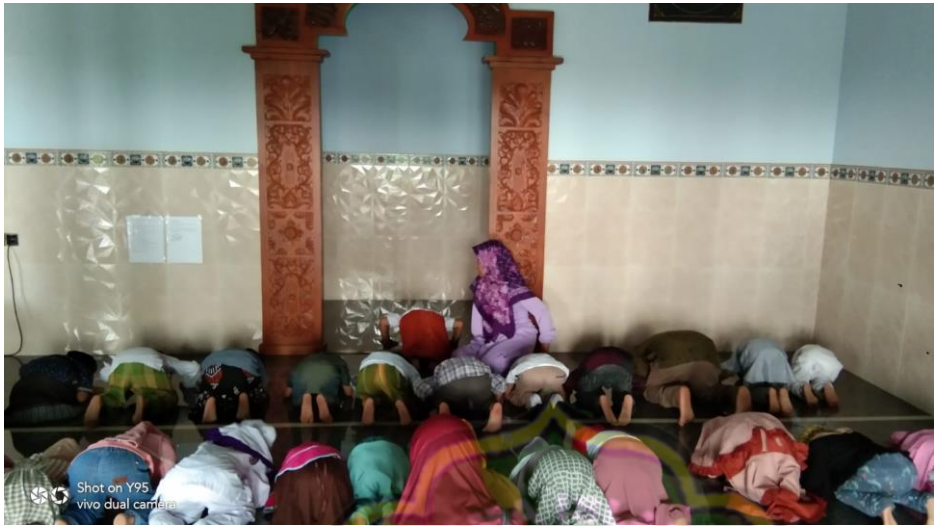
Dokumentasi kegiatan berjamah