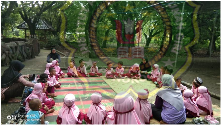
Dokumentasi kegiatan menghafal