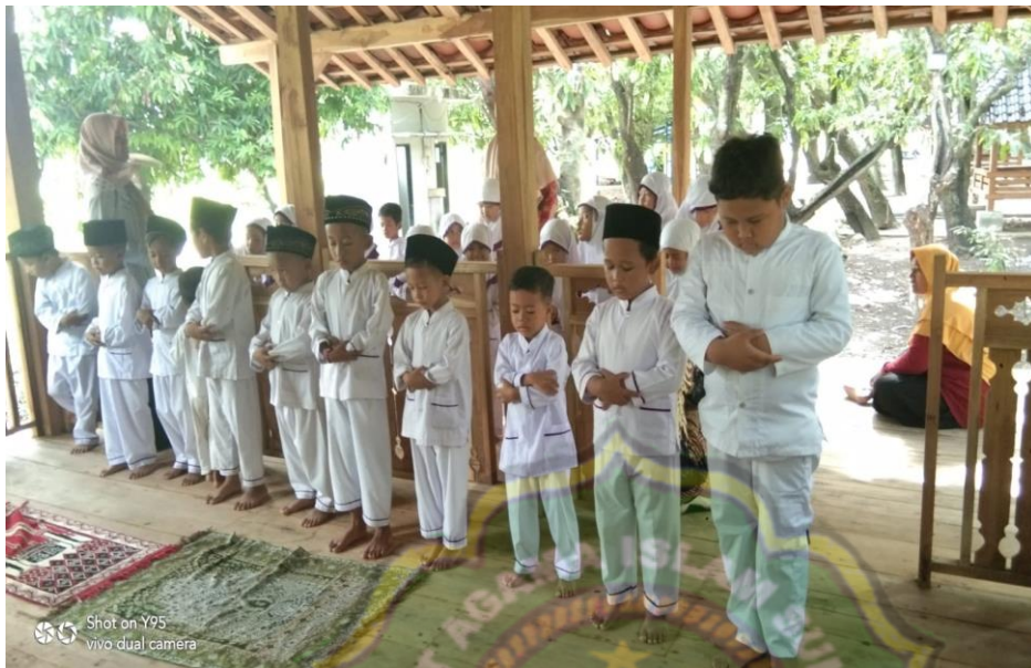
Dokumentasi kegiatan sholat berjamaah