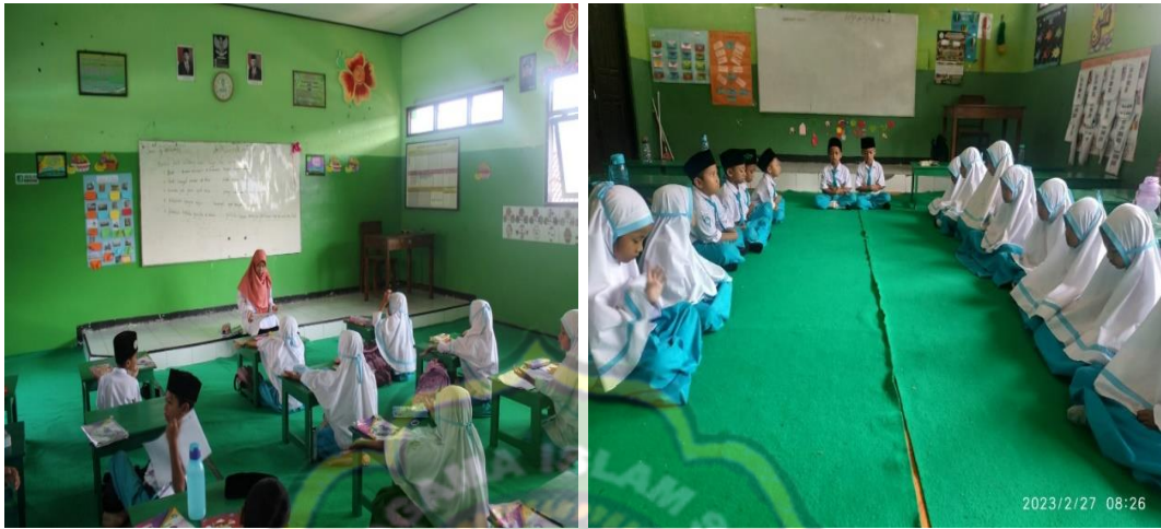
Gambar 4.3 Gambar pelaksanaan Program Unggulan Tahfidz