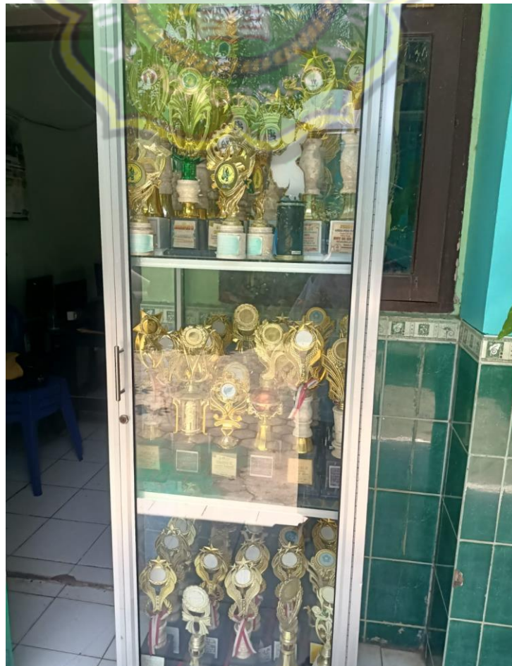
Gambar 4.6 Gambar piala prestasi MIN 7 Ponorogo