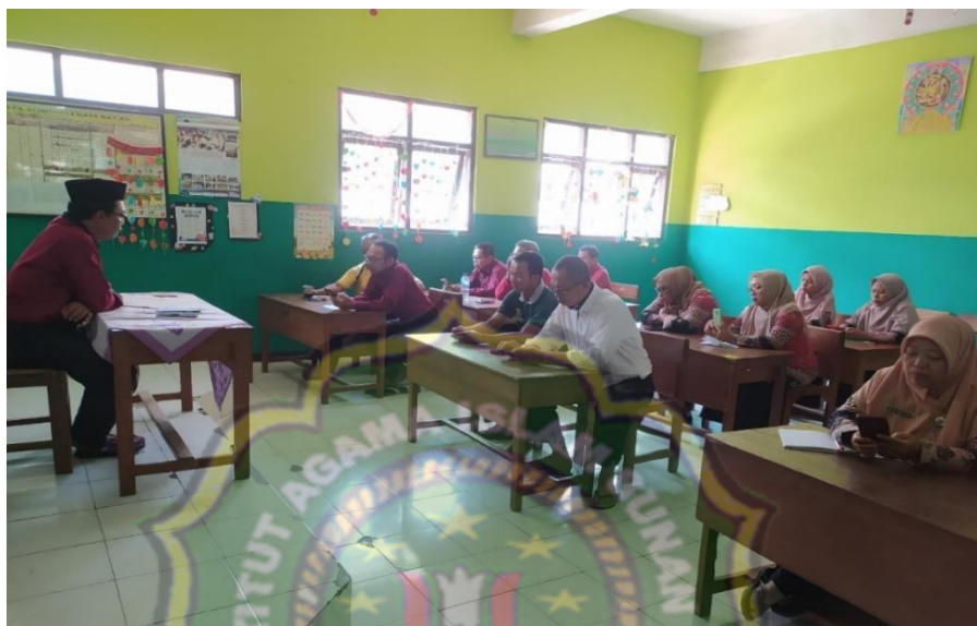
Gambar 4.1 gambar rapat program kerja unggulan tafidz