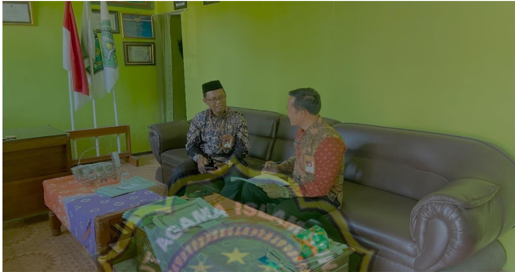
Gambar 4.5 Gambar wawancara dengan kepala MIN 7 Ponorogo