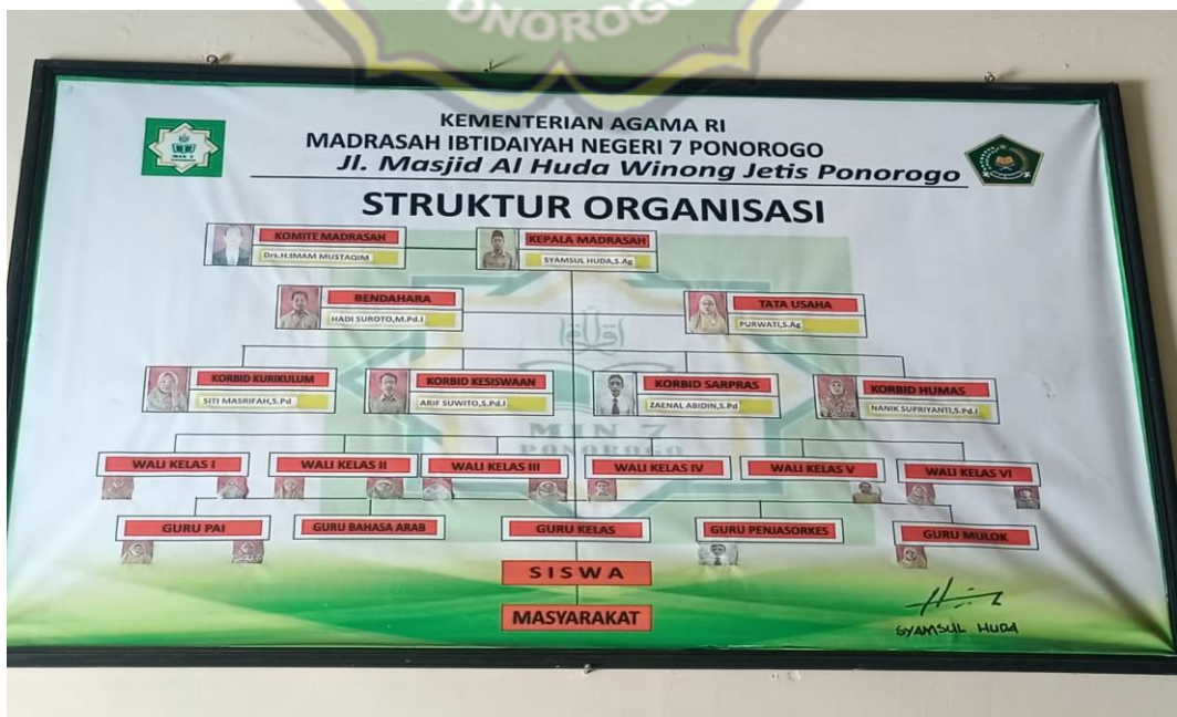
Gambar 4.4 Gambar struktur MIN 7 Ponorogo