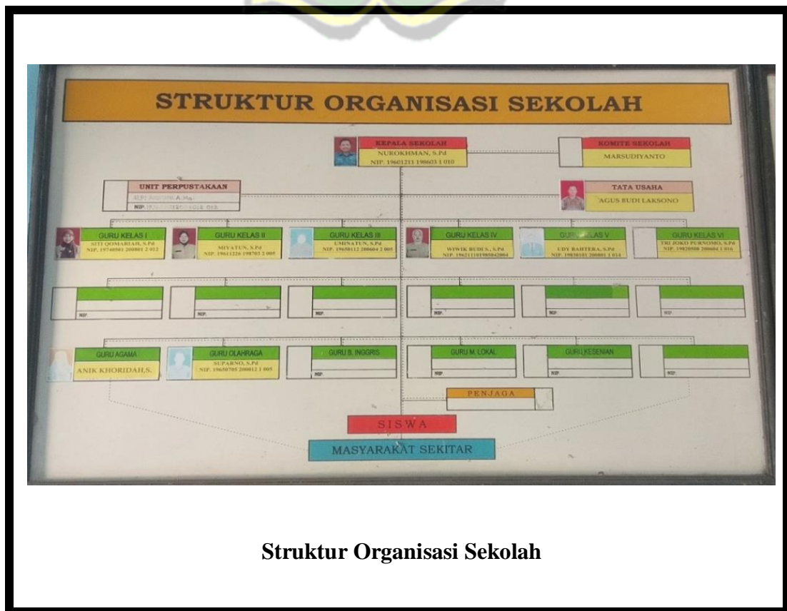
Struktur Organisasi Sekolah