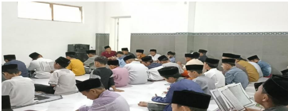
Gambar 4.5 Kegiatan keagamaan khusus hari jum'at

Setiap hari Jumat, sebelum belajar siswa melakukan kegiatan keagamaan ubudiyah seperti istighosah, yasinan, tausiyah dan tahlilan. Setelah itu kegiatan dilanjutkan dengan senam pagi. Hasil observasi menunjukkan bahwa semua siswa dan guru terlibat aktif dalam kegiatan keagamaan khusus pada hari jum'at. Sebagaimana dokumentasi yang telah dilakukan tentang pembiasaan keagamaan khusus hari jum'at sebagai berikut :