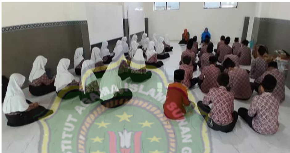
Gambar 4.3 Kegiatan Membaca Doa Harian

Sebagaimana dokumentasi penelitian yang telah dilakukan tentang pembiasaan membaca doa harian sebagai berikut : 15