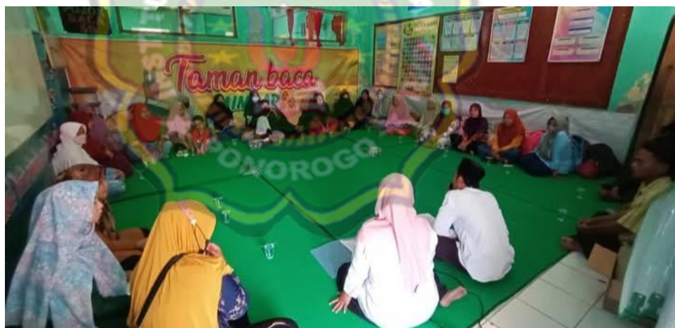
Gambar 4.16 Keterlibatan Orang Tua Siswa

Sebagaimana dokumentasi yang telah dilakukan tentang keterlibatan orang tua dalam pembentukan karakter siswa religius sebagai berikut 49 :