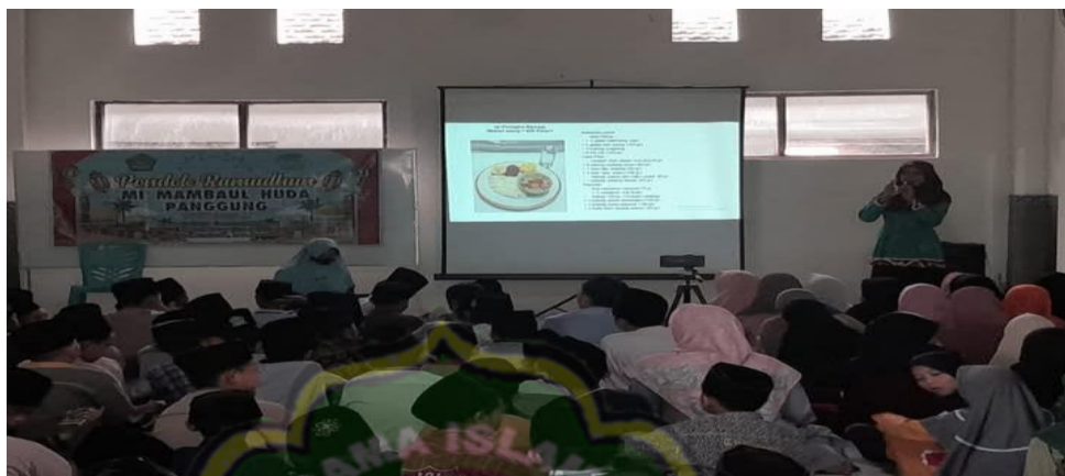
Gambar 4.12 Keteladanan dalam akhlaq sehari-hari