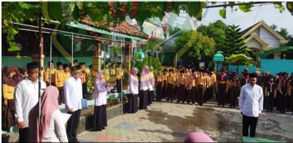
Gambar 4.14 Komitmen Kepala Sekolah dan Guru

Sebagaimana dokumentasi yang telah dilakukan tentang komitmen kepala sekolah dan guru sebagai berikut : 40