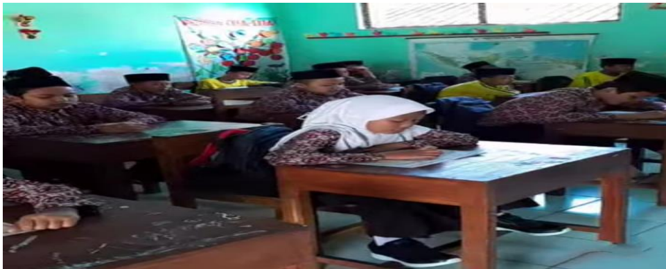
Gambar 4.18 Pembelajaran Siswa di Kelas

Sebagaimana dokumentasi yang telah dilakukan pada saat pembelajaran untuk pembentukan karakter religius sebagai berikut : 55