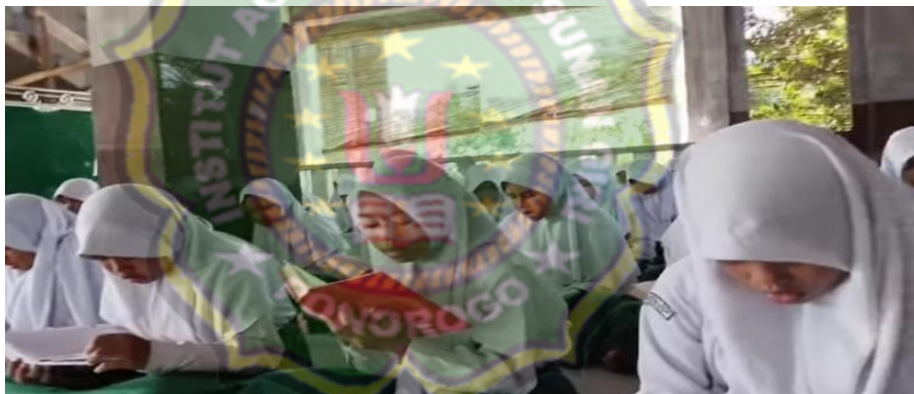
Gambar 4.2 Kegiatan tadarus Al Qur'an, hafalan surat pendek dan asmaul husna

Sebagaimana dokumentasi yang telah dilakukan tentang pembiasaan tadarus Al-Qur'an, hafalan surat pendek dan asmaul husna sebagai berikut: 13