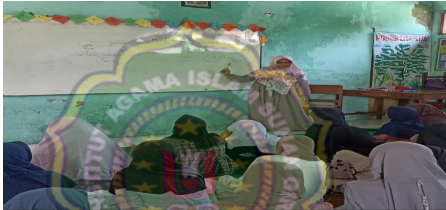
Gambar 4.7 Kegiatan Pembiasaan Pembelajaran dengan Sopan dan Etika

Sebagaimana dokumentasi yang telah dilakukan tentang pembiasaan sopan santun dan etika sebagai berikut : 21