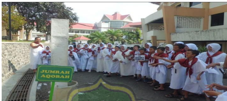
Gambar 4.17 Kegiatan Manasik Haji Siswa MI