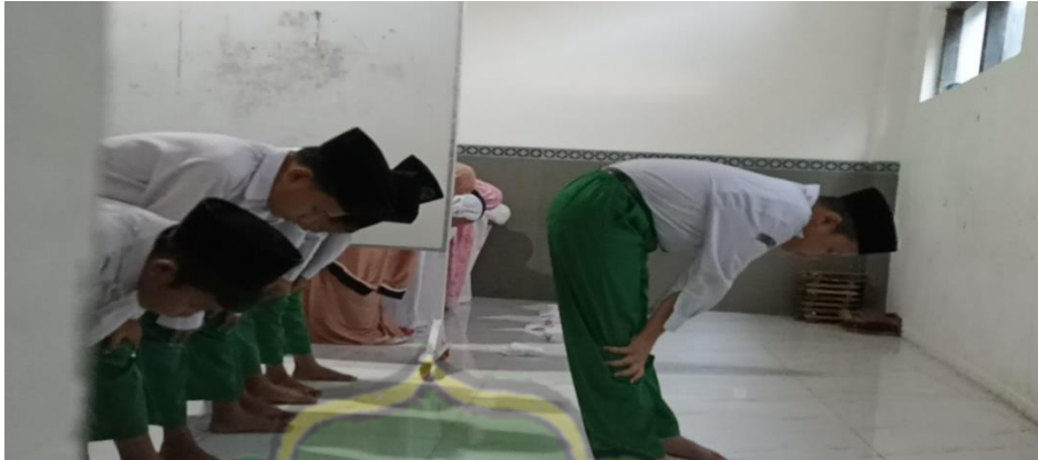
Gambar 4.4 Kegiatan pembiasaan sholat dzuhur berjamaah