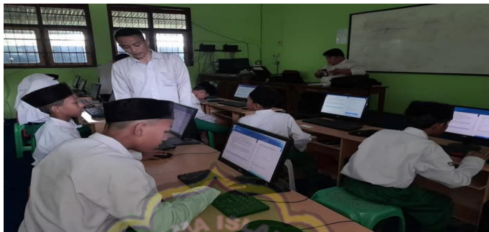
Gambar 4.13 Keteladanan dalam sikap disiplin

Berdasarkan hasil wawancara, observasi, dan dokumentasi, dapat disimpulkan bahwa metode keteladanan telah di implementasikan secara kontinyu oleh para guru dan tenaga pendidik dalam membentuk karakter religius siswa. Dilakukan dengan menggunakan keteladanan sengaja maupun keteladanan yang tidak sengaja. Implementasi metode keteladanan di MI Mambaul Huda Panggung Barat Magetan telah berjalan secara konsisten, terencana, dan berdampak positif terhadap pembentukan karakter religius siswa. Guru bukan hanya mengajar, tetapi menjadi model hidup bagi siswa dalam menjalankan nilai-nilai Islam secara nyata.