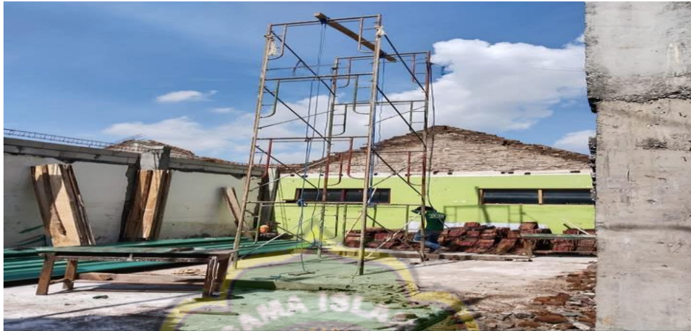
Gambar 4.19 Kondisi Bagian Gedung MI Mambaul Huda

Berdasarkan hasil wawancara, observasi dan dokumentasi dapat disimpulkan bahwa implementasi metode pembiasaan dan keteladanan dalam membentuk karakter religius pada siswa MI Mambaul Huda Panggung Barat Magetan didukung oleh lima faktor utama: komitmen kepala madrasah dan guru, budaya madrasah yang religius, kegiatan keagamaan yang konsisten, keterlibatan orang tua, dan lingkungan madrasah yang mendukung. Seluruh faktor ini saling berkaitan dan membentuk ekosistem pendidikan yang mendukung pembentukan karakter religius secara menyeluruh dan berkelanjutan.