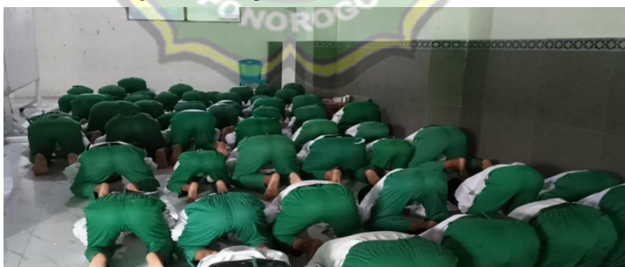
Gambar 4.1 Pelaksanaan sholat dhuha berjamaah

Sebagaimana dokumentasi yang telah dilakukan tentang pembiasaan shalat dhuha berjamaah sebagai berikut : 11