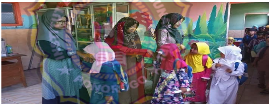
Gambar 4.6 Kegiatan Pembiasaan Salam dan Menyapa

Sebagaimana dokumentasi yang telah dilakukan tentang pembiasaan ucapan salam dan menyapa sebagai berikut : 19