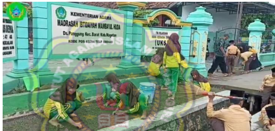
Gambar 4.8 Kegiatan Menjaga Kebersihan Sekolah

Sebagaimana dokumentasi yang telah dilakukan tentang pembiasaan menjaga kebersihan sekolah sebagai berikut : 23