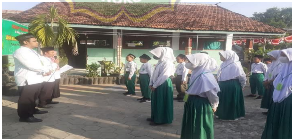
Gambar 4.11 Keteladanan dalam etika dan berpakaian

Sebagaimana dokumentasi yang telah dilakukan tentang keteladanan dalam sikap dan etika berpakaian sebagai berikut : 32