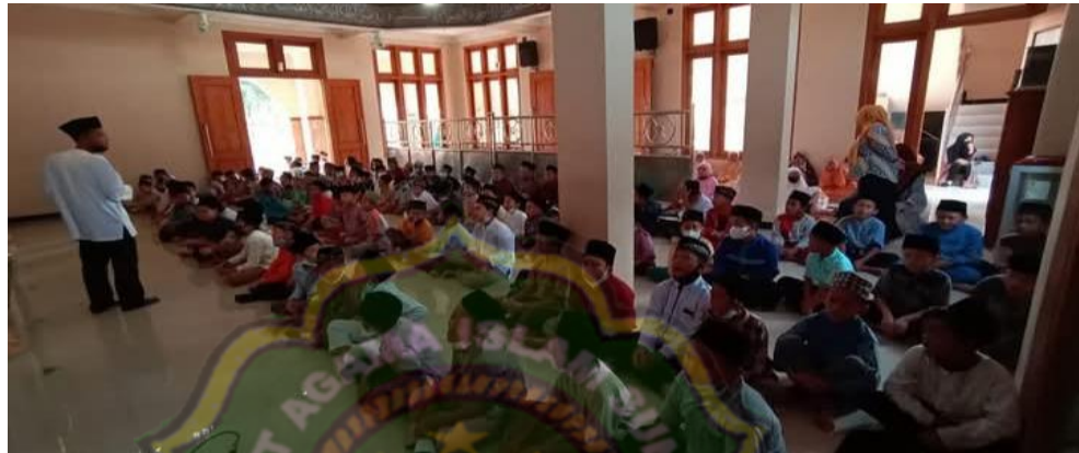
Gambar 4.10 Keteladanan dalam beribadah

Sebagaimana dokumentasi yang telah dilakukan tentang keteladanan dalam beribadah sebagai berikut : 30