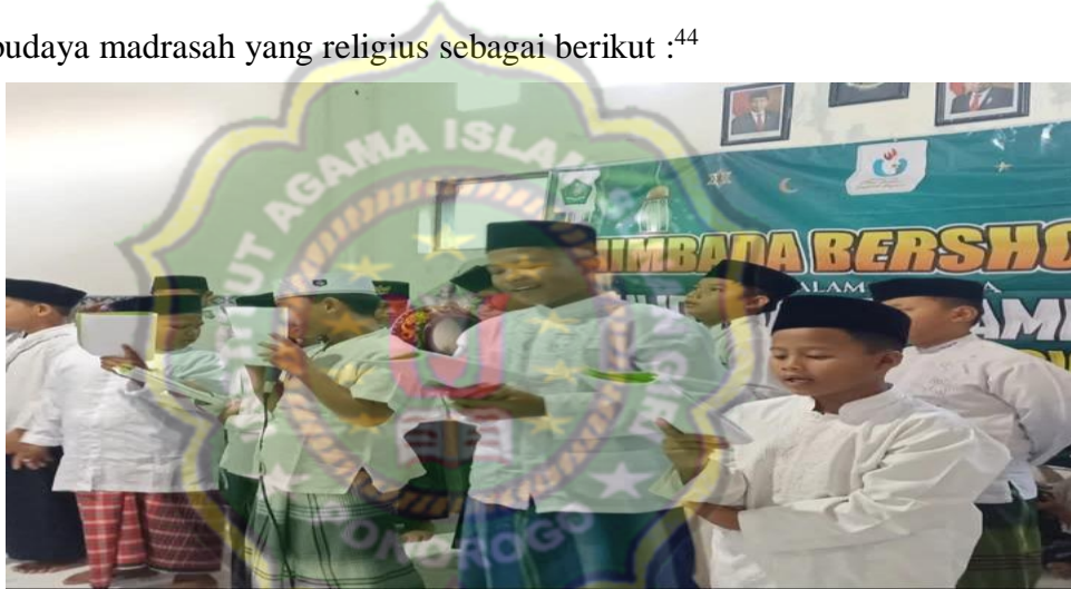
Gambar 4.15 Budaya Madrasah Religius

Sebagaimana dokumentasi penelitian yang telah dilakukan tentang budaya madrasah yang religius sebagai berikut : 44