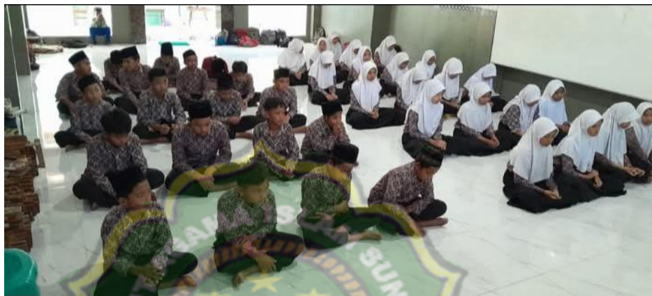
Gambar 4.9 Siswa Memakai Seragam Rapi

Sebagaimana dokumentasi yang telah dilakukan tentang pembiasaan