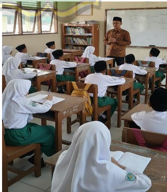
Gambar 1.3 Dokumentasi Kegiatan Pembelajaran Akidah Akhlak di Kelas 5C MI Sailul Ulum Pagotan Madiun

Data-data tersebut, jelas memperlihatkan bahwa strategi yang diterapkan guru Akidah Akhlak berjalan efektif. Kedisiplinan siswa