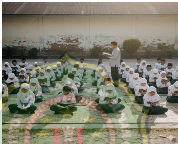
Gambar 1.2 Dokumentasi Kegiatan Tadarus Pagi di MI Sailul Ulum Pagotan Madiun

Dari foto kegiatan tadarus pagi di atas, terlihat bahwa siswa berbaris rapi di halaman dengan membawa Al-Qur'an. Pembiasaan ini melatih kedisiplinan melalui rutinitas. Kegiatan berulang membuat perilaku disiplin menjadi kebiasaan yang terbentuk secara sadar tanpa paksaan.