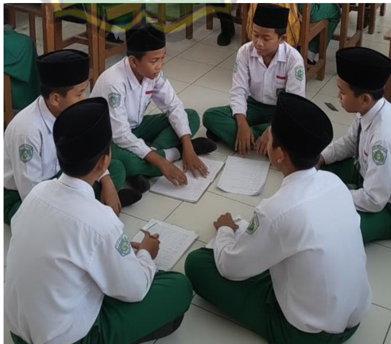
Gambar 1.4 Dokumentasi Kegiatan Diskusi saat Pembelajaran Akidah Akhlak di Kelas 5A (MI Sailul Ulum Pagotan Madiun)

Hasil observasi menunjukkan siswa mampu berbicara sopan dalam interaksi sehari-hari, menghormati guru, teman, dan orang lain, serta menggunakan kata-kata yang sesuai adab Islami. Foto dokumentasi kegiatan diskusi dan interaksi kelas menunjukkan siswa mampu mengekspresikan pendapat dengan santun dan tertib.