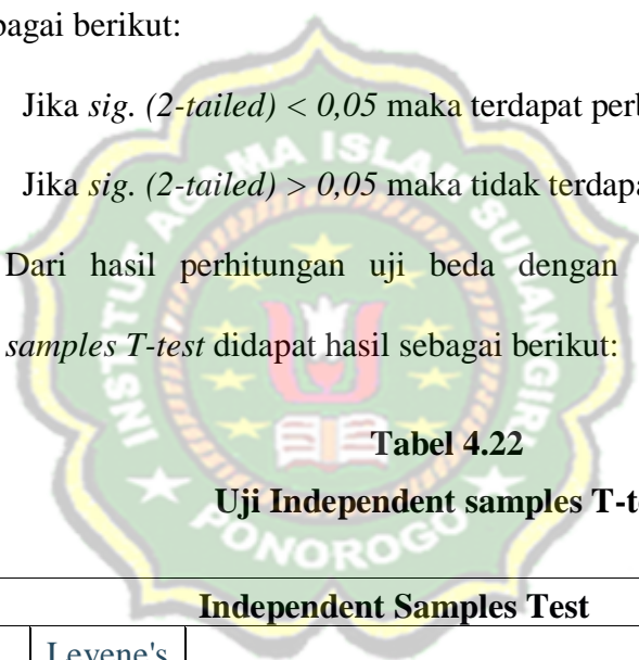
Tabel 4.22 Uji Independent samples T-test

Dari hasil perhitungan uji beda dengan rumus Uji Independent samples T-test didapat hasil sebagai berikut: