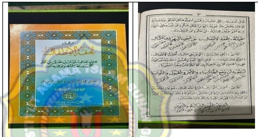
Foto IV. 1. Kitab Tuhfatul Athfal

Keluarga, Shahabat, Tabi'in, Para pembaca Al – Qur'an, Para pendengar Al – Qur'an.