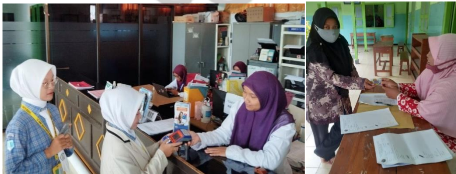
Gambar 4.6 Orang Tua/Wali Peserta Didik Sedang Membayar Infaq Pendidikan di MI Ma'arif Panjeng Jenangan Ponorogo 225

Tidak adanya keberatan dalam membayar infaq pendidikan untuk anak-anaknya, berikut ini disampaikan hasil dokumentasi yang menunjukkan orang tua/wali yang sedang membayar infaq pendidikan anak di MI Ma'arif Panjeng Jenangan Ponorogo dengan tertib.