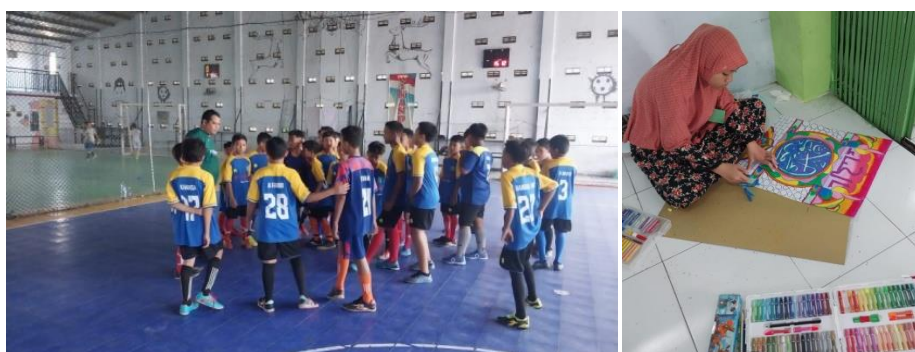
Gambar 4.3 Kegiatan Ekstrakurikuler Futsal dan Kaligrafi di MI Ma'arif Panjeng Jenangan Ponorogo 120

Berikut ini disampaikan dokumentasi tentang kegiatan ekstrakurikuler yang diselenggarakan di MI Ma'arif Panjeng Jenangan Ponorogo.