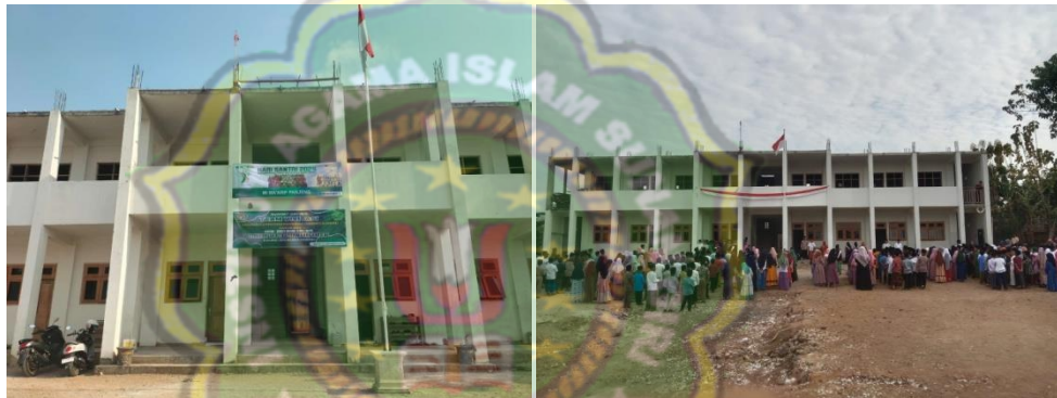
Gambar 4.1 Keadaan Fisik Bangunan MI Ma'arif Panjeng Jenangan Ponorogo 103

Keadaan fisik bangunan di MI Ma'arif Panjeng belum memadai, 6 ruang kelas memakai ruang kelas darurat untuk kegiatan pembelajaran. 102 Berikut ini dokumentasi keadaan fisik bangunan di MI Ma'arif Panjeng yang diperoleh peneliti.