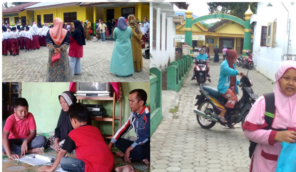
Gambar 4.5 Berbagai Bentuk Upaya Orang Tua dalam Merealisasikan Motivasinya dalam Menyekolahkan Anak di MI Ma'arif Panjeng Jenangan Ponorogo 185

Data tentang motivasi orang tua dalam menyekolahkan anak di MI Ma'arif Panjeng Jenangan Ponorogo dalam penelitian ini tidak hanya berasal dari hasil wawancara, namun juga diperoleh dari hasil dokumentasi dan observasi. Hal ini dilakukan dengan pertimbangan untuk memperoleh keabsahan/kevalidan data melalui triangulasi teknik. Berikut ini beberapa dokumentasi tentang beberapa hal yang berkaitan dengan motivasi orang tua dalam menyekolahkan anak di MI Ma'arif Panjeng Jenangan Ponorogo: