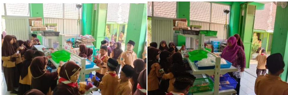
Gambar 4.2 Kondisi Fisik Kantin di MI Ma'arif Panjeng Jenangan Ponorogo 105

Keadaan ruangan di MI Ma'arif Panjeng menunjukkan bahwa untuk meja-kursi murid untuk saat ini sudah cukup memadai, papan tulis sudah menggunakan whiteboard, terdapat 3 (tiga) kelas yang sudah menggunakan media LCD Projector untuk pembelajaran secara permanen. 106 Secara keseluruhan, sarana dan prasarana di MI Ma'arif Panjeng Jenangan Ponorogo serta keadaannya adalah sebagai berikut: 107