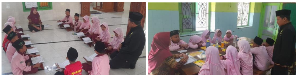
Gambar 4.4 Kegiatan Membaca Al-Qur'an dengan Metode UMMI di MI Ma'arif Panjeng Jenangan Ponorogo 123