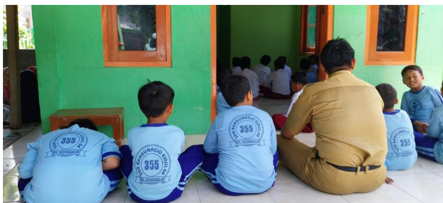
Gambar 4.8 Mura'jaah setelah salat dhuhur putra

“Selanjutnya, ketika anak-anak selesai solat berjamaah dhuhur di sekolah, maka sehabis dzikir dan doa bersama akan dilakukan metode murojaah dengan menggunakan metode ummi ini secara bersama-sama. Selain itu, juga ada waktu khusus diluar jam pelajaran yaitu setiap hari seni sampai dengan kamis sehabis sholat dhuhur anak-anak akan dikumpulkan disatu ruangan kelas untuk diajak muroja'ah bersama-sama untuk mengingatkan hafalan sebelumnya dan juga dilanjutkan diajari metode ummi yang akan dihafalkan berikutnya. Hal ini dilakukan agar anak-anak tidak lupa akan hafalan yang sudah disetorkan sebelumnya. Setelah muroja'ah bersama-sama, Anak-anak akan disuruh untuk setoran hafalannya”. 11