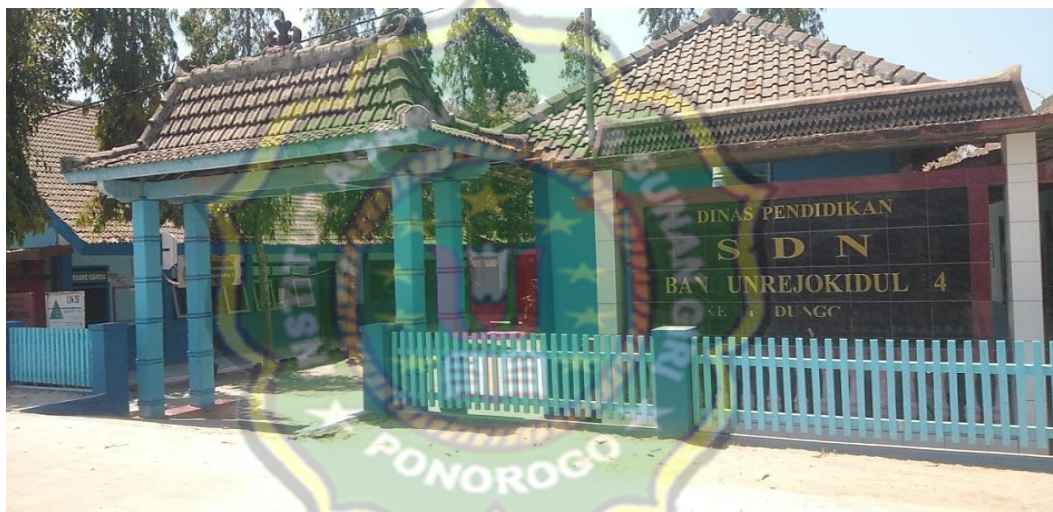
Gambar 4.1 Lokasi Penelitian