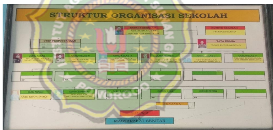
Gambar 4.3 Struktur Organisasi Komite