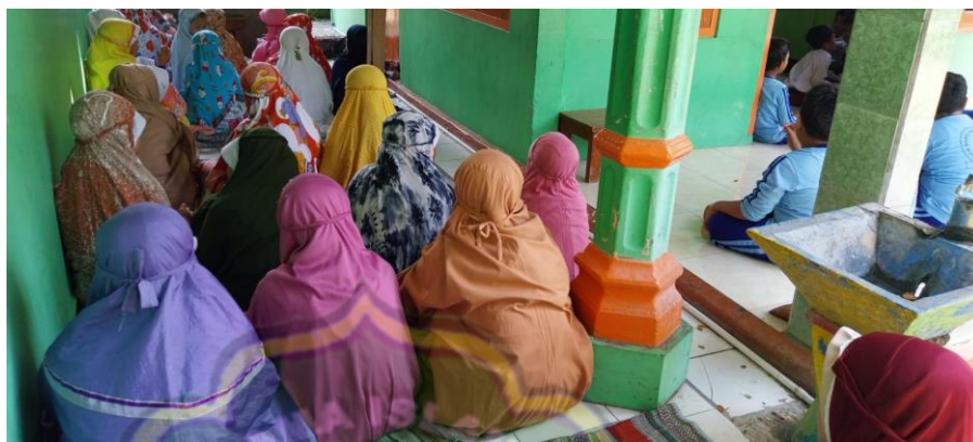
Gambar 4.9 Mura'jaah setelah salat dhuhur putri