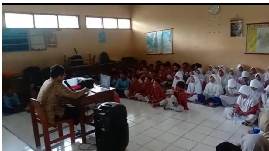
Gambar 4.5 Proses Muraja'ah dengan Menyimak guru