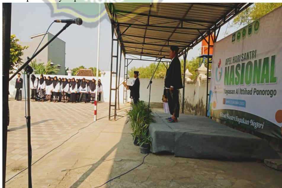
Gambar 4.2 apel hari santri nasional perwujudan internalisasi moderasi beragama aspek Nasionalisme 9

“Setiap tanggal 22 Oktober di madrasah selalu mengadakan kegiatan HSN ( Hari Santri Nasional), biasanya satu minggu menjelang hari santri, ada rangkaian kegiatan seperti perlombaan keagamaan dan olahraga, cerdas cermat, tasyakuran dan puncaknya apel HSN” 8