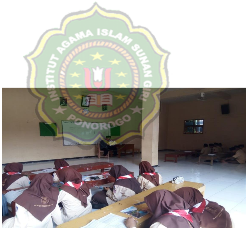
Gambar 4.4. Internalisasi nilai-nilai moderasi beragama aspek toleransi dalam Pelaksanaan Pembelajaran fikih melalui tahap moral knowing dalam diskusi bersama. Pendidik dalam melakukan internalisasi tetap memantau jalannya diskusi dan sebagai fasilitator peserta didik untuk memicu kerja sama dan toleransi antar tim dan individu 31

kebaikan melalui uswah hasanah dalam toleransi di kehidupan sehari-hari yang akan memperkokoh iman dan mempererat tali silaturahmi. 30