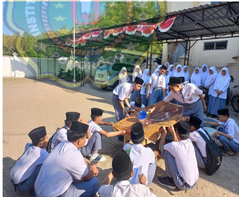
Gambar 4.3 Proyek kerja sama saling menghargai merupakan aplikasi dari toleransi melalui moral action

“salah setu metode yangs saya gunakan adalah diskusi, dalam diskusi ini siswa belajar untuk menghargai pendapat temannya, karena setiap siswa pasti punya pikiran dan pemahaman yang berbeda, terkadang mereka saya suruh mengerjakan proyek” 25