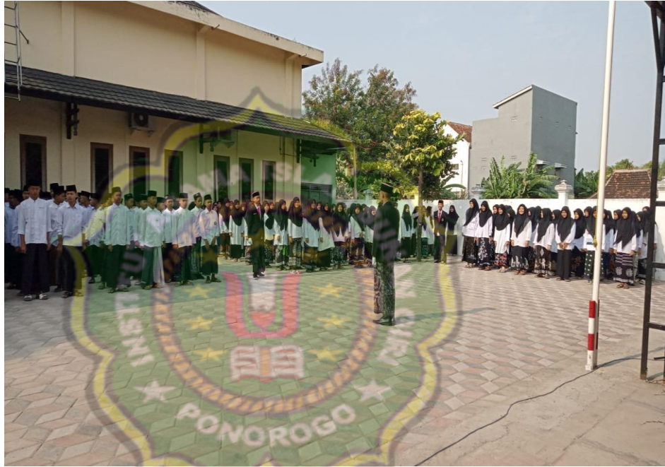
Gambar 4.1 Peringatan hari santri nasional tahun 2023 merupakan moral action 6

nasionalisme tentunya selalu kita libatkan dalam acara-acara nasional dari kegiatan intra maupun ekstra”. 5