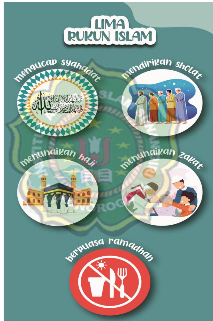
Gambar. 3.2. Media Gambar Ilustrasi Rukun Islam

“Penggunaan media gambar di RA Bakti 3 Sukosewu Sukorejo memiliki tujuan untuk meningkatkan efektifitas pembelajaran keagamaan karena simpel dan menarik serta mudah dipraktikan. 6