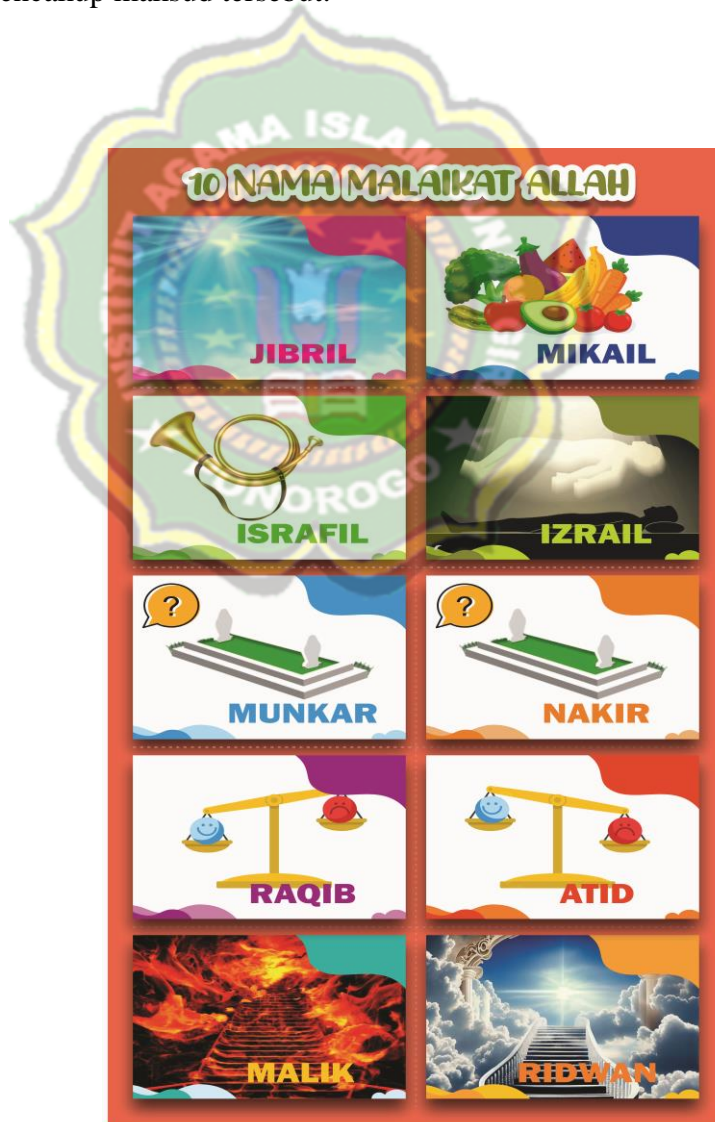
Gambar. 3.3. Media Gambar Ilustrasi Malaikat-Malaikat Allah

“Penentuan gambar memiliki keterbatasan karena tidak semua di Islam itu bisa digambarkan misalnya wajah-wajah Nabi, bentuk malaikat. Dengan demikian harus diupayakan pencarian solusi gambar ilustrasi yang bisa mencakup maksud tersebut. 11