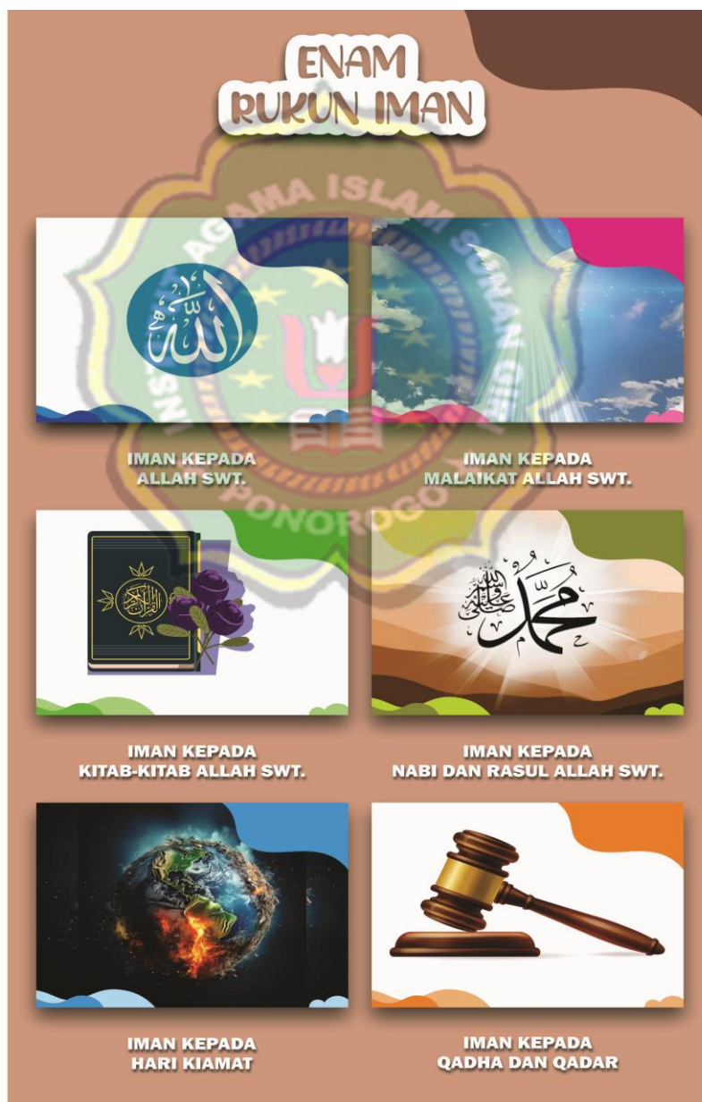
Gambar. 3.1. Media Gambar Ilustrasi Rukun Iman

mengenal malaikat Allah. Nabi-nabi, kitab-kitab dll. Itu gambar-gambar yang kita siapkan. Kita sengaja menggunakan gambar ilustrasi agar memudahkan mereka dalam memahami, pakai gambar kartun warna warni, sehingga anak tertarik” 5