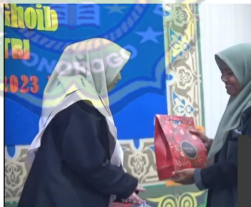
gambar 3.1 (Penghargaan kepada santri) 67

Selain motivasi yang disebutkan diatas sebenarnya ada motivasi yang berasal dari dalam diri santri itu sendiri, biasanya para santri akan bersemangat untuk segera selesai sorogan dan bisa segera diizinkan untuk pulang, namun itu khusus bagi santri yang tidak hafalan Al-Qur'an . Terlihat dari beberapa santri sangat semangat mengikuti sorogan dikarenakan ingin segera selesai 30 juz binadzar agar segera bisa pulang ke rumah. Pada hari selasa saat masuk ke asrama putri, banyak santri yang membuat ceklist