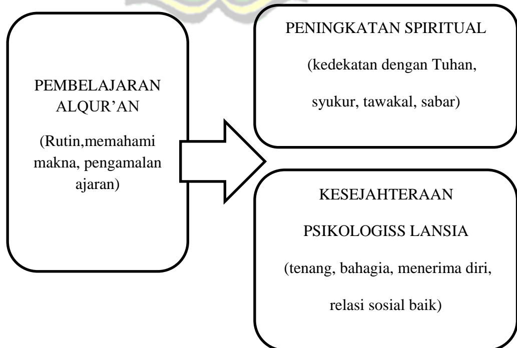
Gambar. 2.1 Paradigma pemikiran

Dengan demikian, dapat dirumuskan bahwa pembelajaran Al-Qur'an berpengaruh terhadap peningkatan spiritual lansia, dan spiritualitas yang meningkat berkontribusi pada peningkatan kesejahteraan psikologis mereka. Maka, semakin aktif lansia mengikuti pembelajaran Al-Qur'an, semakin tinggi spiritualitas dan kesejahteraan psikologis yang dimilikinya. Secara sederhana skema pemikiran dapat digambarkan sebagai berikut :