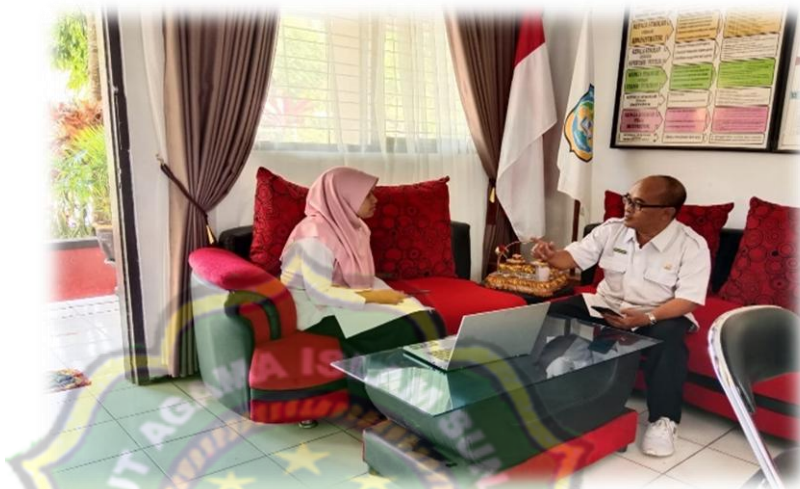
Gambar 1: Wawancara peneliti dengan guru PKn SMPN 2 Sooko

Peneliti yang merupakan kepala sekolah SMP Negeri 2 Sooko memvalidasi pernyataan di atas. Kurikulum yang dipergunakan di SMPN 2 Sooko untuk kelas 9 masih mempergunakan kurikulum 2013 (K-13). Kurikulum Merdeka baru dilaksanakan pada tahun ini untuk kelas di bawahnya.