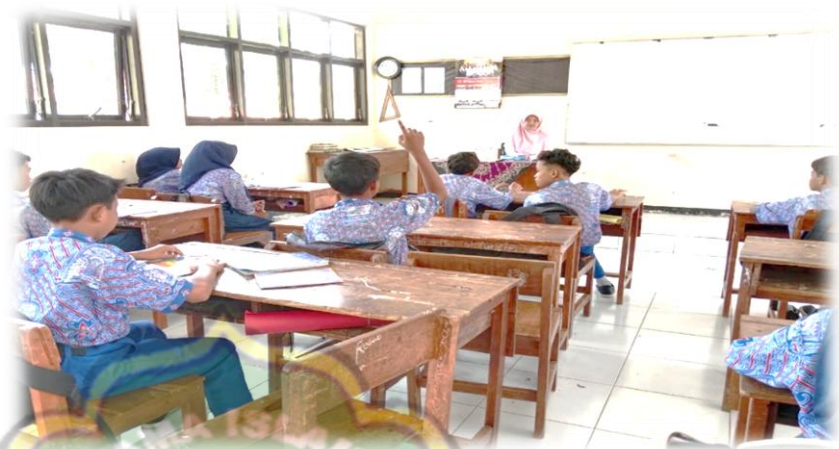
Gambar 2. Guru sedang mengabsensi siswa-siswi