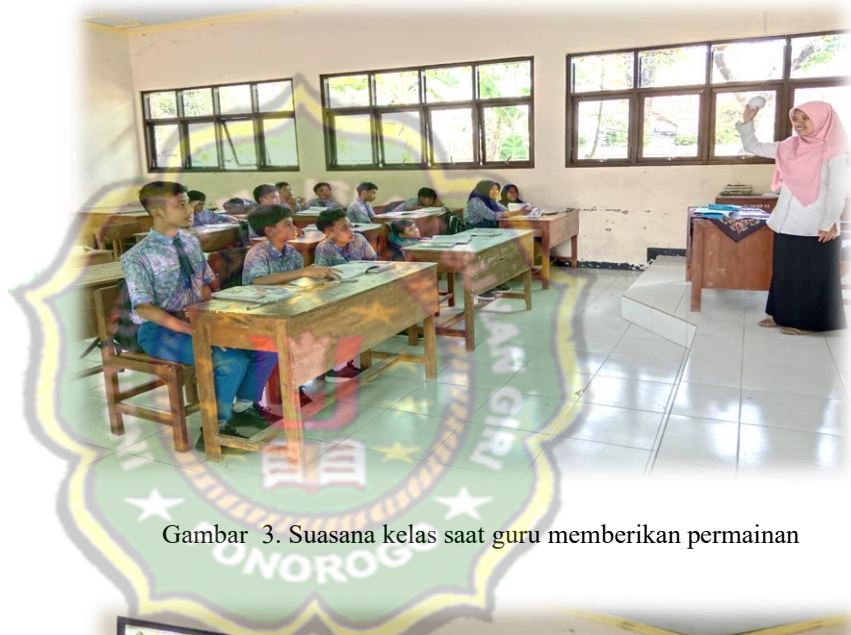
Gambar 3. Suasana kelas saat guru memberikan permainan

pertanyaan dari guru 12 . Guru memberikan permainan terlebih dahulu kepada siswa-siswi sebelum materi pelajaran dimulai yang terlihat pada Gambar 3.