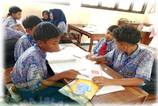
Gambar 6. Siswa-siswi sedang berdiskusi dengan kelompoknya

Deskripsi hasil observasi pada kegiatan inti pembelajaran bentuk penerapan pembelajaran Pendidikan Kewarganegaraan (PKn) melalui pendekatan CTL terlihat pada observasi tanggal 24 April 2024 tentang mengkaitkan contoh norma dalam kehidupan nyata. Hasil pembentukan karakter disiplin siswa terlihat pada observasi 17 April 2024 pembelajaran Pendidikan Kewarganegaraan (PKn) pada saat guru meminta setiap siswa untuk mengerjakan tugas secara mandiri. Observasi 24 April 2024 terlihat guru meminta siswa melakukan diskusi secara kelompok, guru mengajarkan karakter disiplin siswa yaitu bekerja sama dengan teman sekelompoknya.