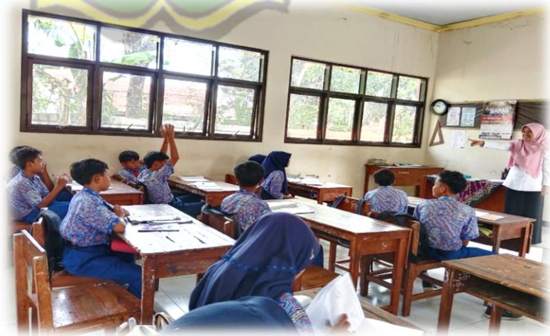
Gambar 4. Suasana kelas saat guru memberikan permainan

Dari uraian kegiatan pendahuluan di atas dapat diambil pemahaman bahwa guru Pendidikan Kewarganegaraan (PKn) kelas 9 didalam kegiatan pendahuluan membuka pelajaran