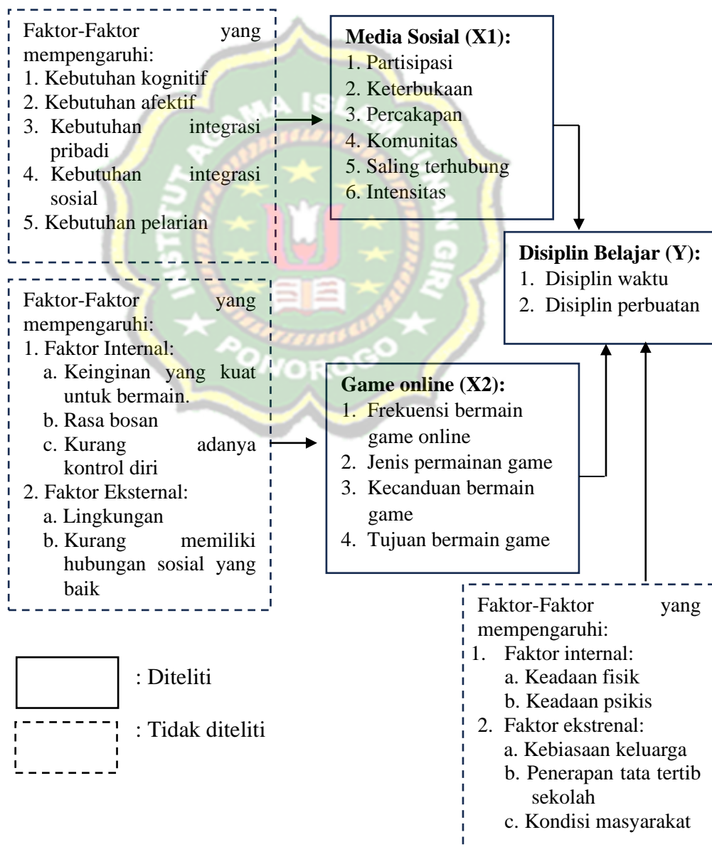
Gambar 2.1 Kerangka Berpikir